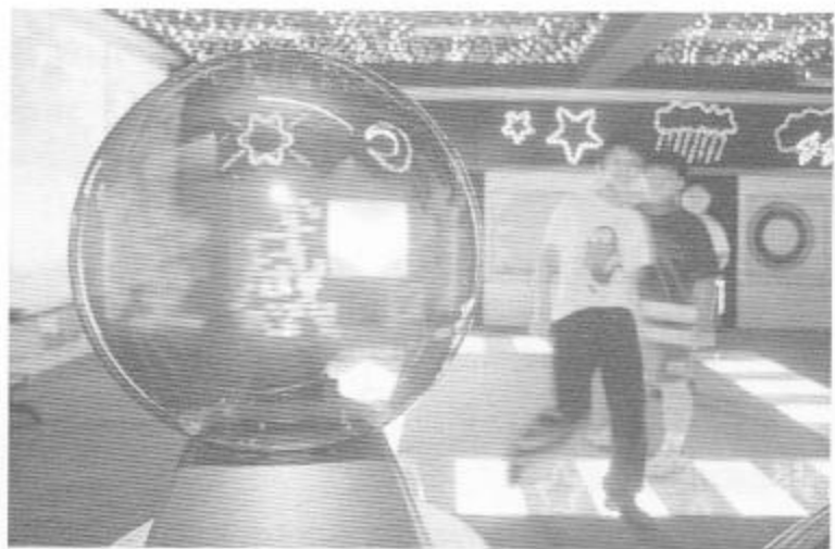
為訓練弱智學生的視覺、聽覺、觸覺及肌肉能力，學校設有「感官刺激訓練室」，提供閃燈、音響及電視器材。