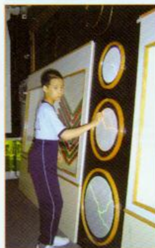
▲同學在感官刺激訓練室內主動接觸熱能感應光板