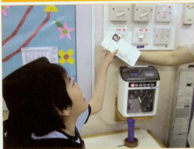
▲同學們「打卡」模擬上班的情況