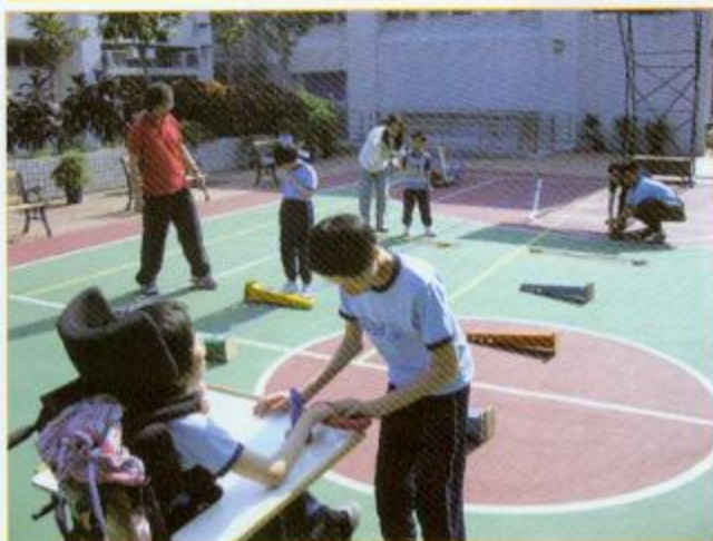
▲戶外活動教學能提高學生的溝通和社交能力