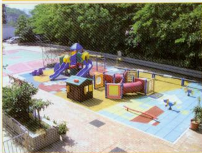
▲戶外活動教學園增加學生活動範圍

此外，戶外活動教學園還安裝了擴音及音響系統，以音樂舒緩學生情緒，鼓勵學生進行活動，並能支援學校舉行全校性的戶外活動。另有安裝燈光，提供住宿生晚上使用的機會，增加成本效益；並設安全圍欄、地面軟墊，一方面能保護學生，另一方面減少教職員對學生安全之顧慮，使能專心教學，提升服務質素。