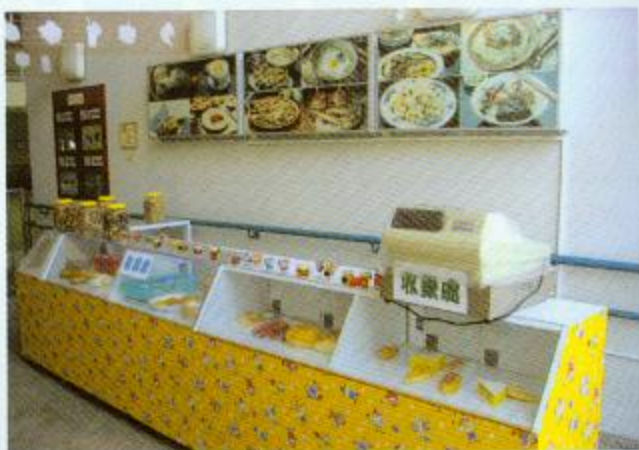
▲模擬快餐店有很多食物可以選擇！