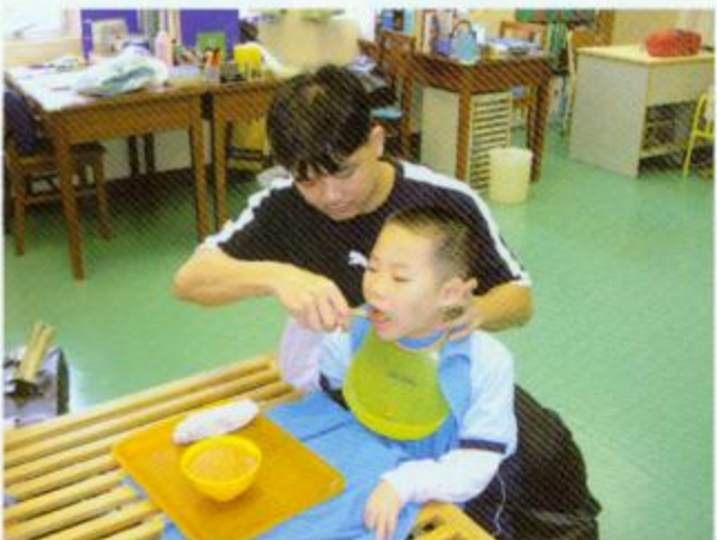
▲同學們自我餵食亦是引導式教育課程之一