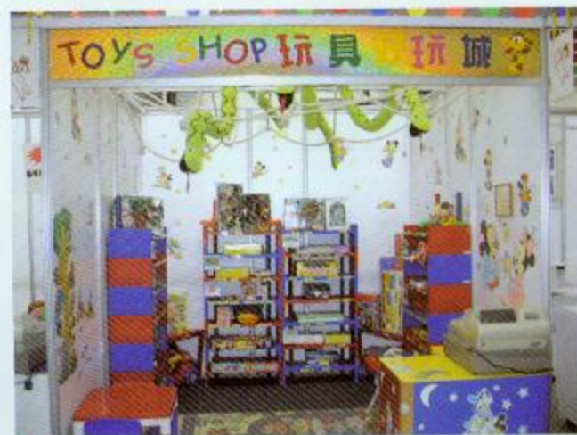
▲這個玩具店佈置得很精緻呢！