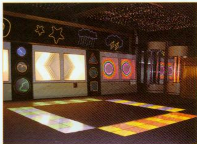
▲成年人也會被這些光線吸引吧！

室內的走地燈，同學們跟著閃燈前進，透過燈光的閃動，啟發他們的主動性，從而訓練他們的大肌肉活動能力。除此之外，還有應聲燈板，可以隨著同學拍手和說話而閃動，分辨出上下、左右及裏外的方向，藉此訓練學生們的主動活動能力。