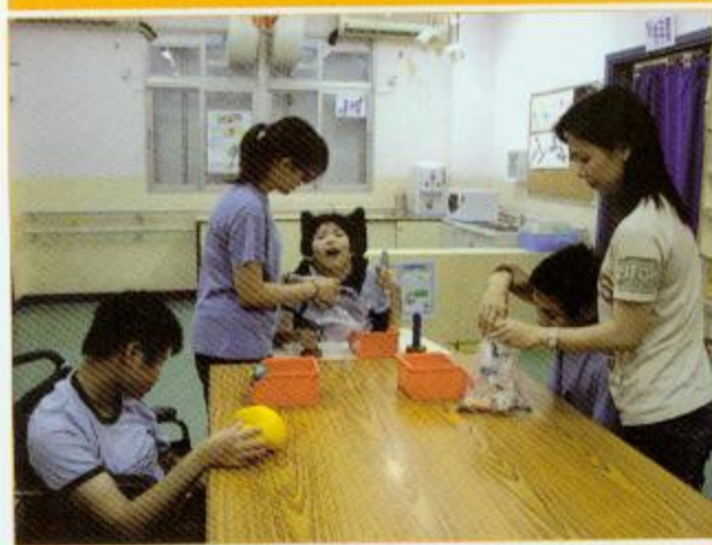
▲同學在學習包裝工作