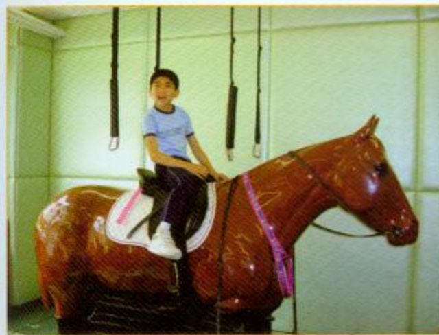
▲利用馬匹治療，可訓練同學的平衡力

馬術治療的目的在於深化同學服從指示的能力，達至遊戲治療的效果。訓練包括：策騎馬匹漫步、快跑、上落斜坡、傳送豆袋、套膠圈、掛絲帶等。通過馬術治療可以促進學生的自信心以及平衡力。很多坐姿不穩的同學在接受馬術治療後均會學懂平衡力，對他們平日活動很有幫助。