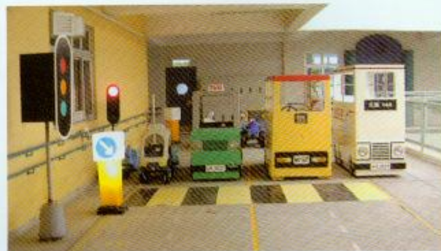
▲交通城是保良局羅氏信託學校獨有的主題教材

至於交通城則是社會各樣交通工具的縮影，當中包括巴士、小巴、的士及輕鐵等交通工具。同學可在上課時，試乘各樣模擬交通工具及認識過馬路的設施如紅綠燈和斑馬線等。而人物廊內有不同人物造型，例如護士、醫生、警察、郵差及消防員等，目的是讓學生透過人物介紹，從而認識社會上不同的工作崗位。