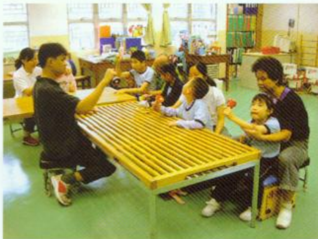
▲同學正在進行手肌訓練

為配合不同層面的學生，課程亦須分類才能全面。故課程分有三大類：低年級適應課程，這是為剛從特殊幼兒院過渡學校的小朋友而設，與正常學童由幼稚園升讀小一相似。課程目標是讓學生銜接日後更高程度的課程，讓他們習慣學校的生活。其次是針對中班學生的引導式課程，課程目的在於透過小組、團隊、傢俱及輔助儀器，提供一套整合流程的學習；包括坐姿平衡、步行訓練、躺臥、溝通、手肌及自理習作等，從而誘發大腦麻痺學童的主動學習，對他們的發展非常重要。