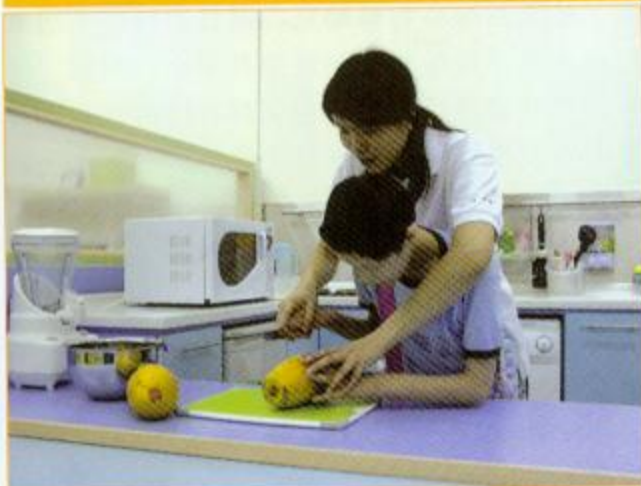
▲治療師協同學烹飪