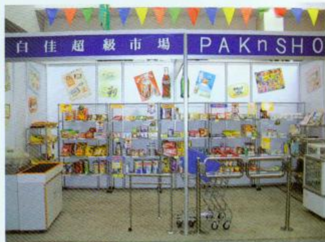
▲這就是超級市場的縮影了，看不出是模仿的吧！

主題教學園分有幾個景點，計有購物街、交通城及人物廊。同學透過這樣的學習環境，可以學習到衣、食、住、行的基本常識。購物街其實是一個商場的縮影，內有超級市場、玩具店、衣服店及快餐店。透過老師的悉心教導，同學可以學懂購買日常用品、食物、玩具等，讓他們容易適應現實環境。