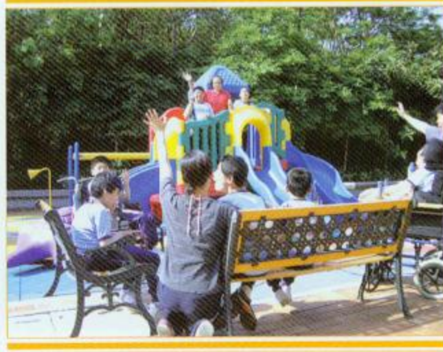
▲學生都很喜歡在戶外活動教學園上課呢！