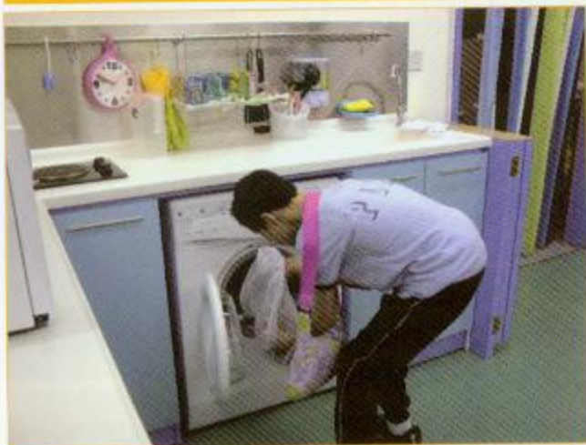
▲同學在「家居庭」學習使用洗衣機

十六歲以上的嚴重弱智學童過渡至成人階段，使他們更能適應畢業後的生活環境，加強自理和溝通能力，提早準備日後在展能中心或護理院的生活。課程著重家居、工作、社區以及閒暇四大範疇的訓練。學校並將兩個班房改裝成「家居庭」及「展能閣」，配合延伸課程的訓練。顧名思義，「家居庭」是模擬真實的家庭環境，提高學生在家中的自理能力，例如學習烹飪、收拾床舖及洗衣服等。「展能閣」就是將班房設計成模擬展能中心，學生在這裡可學習類似展能中心的包裝及裝配工作。