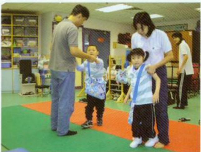
▲老師與治療師協同學進行步行訓練