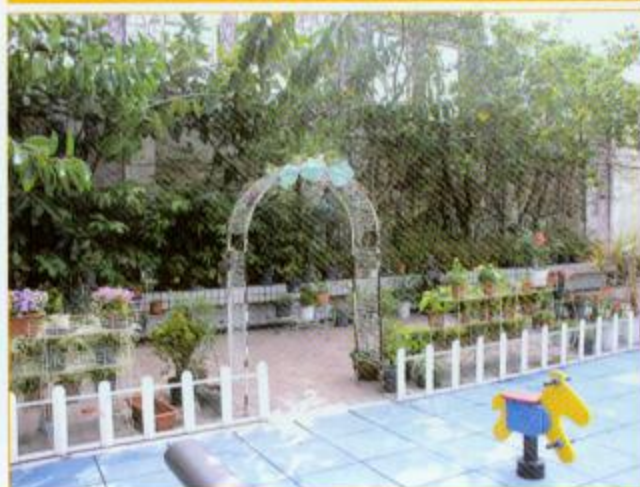
▲戶外活動教學園內還有一個綠田園的地方，綠化環境之餘亦可教導學生植物常識