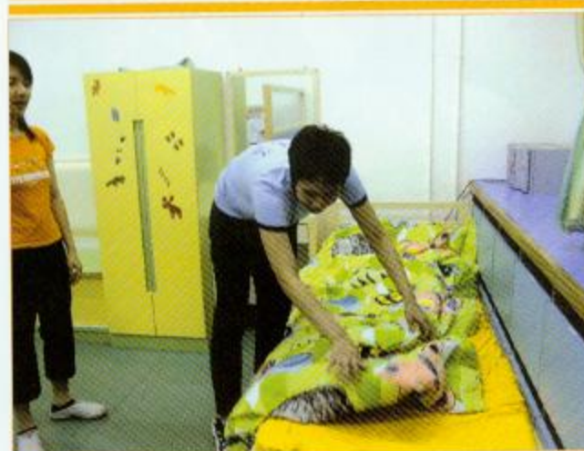
▲同學正在學習自我收拾床舖