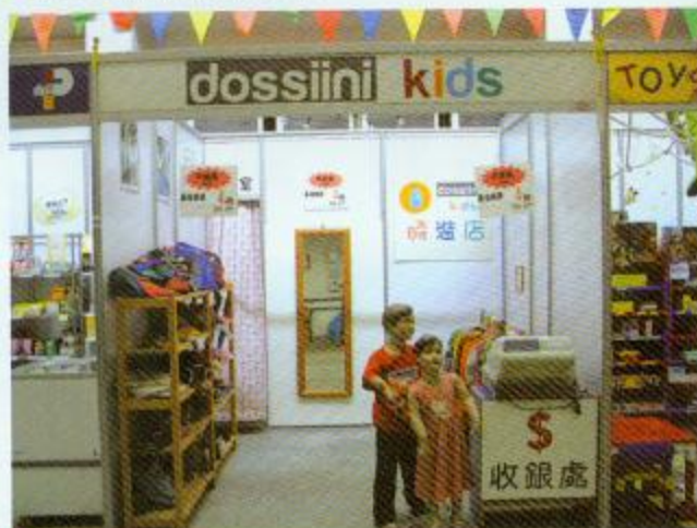
▲時裝店也有試身室呢！

至於交通城則是社會各樣交通工具的縮影，當中包括巴士、小巴、的士及輕鐵等交通工具。同學可在上課時，試乘各樣模擬交通工具及認識過馬路的設施如紅綠燈和斑馬線等。而人物廊內有不同人物造型，例如護士、醫生、警察、郵差及消防員等，目的是讓學生透過人物介紹，從而認識社會上不同的工作崗位。