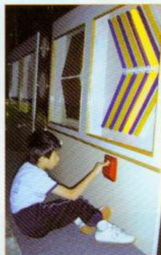
▲同學在感官刺激訓練室內主動開關不同顏色的光管

校園除了室內設施之外，還有室外呢！在學校範圍內有一個戶外活動教學園，它的設立與遊戲治療法的引入，目的是增強學生進行活動的動機，增加學生戶外活動的機會，從而改善行為問題，並提升教職員戶外教學的技巧，鼓勵家長帶領智障子女進行戶外活動。設施包括社交活動：四節搖搖板、傳聲筒；想像性活