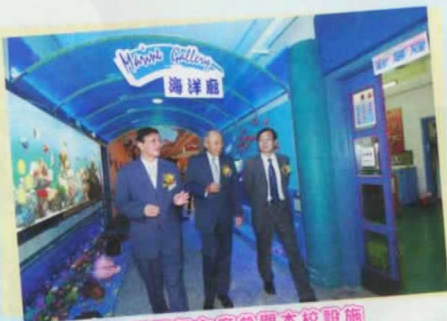
鄧爾邦主席參觀本校設施

留德佛堂衆善長的夢想，感動了在場每位教育工作者。我校既為受惠學校，自當歌盡所能，穩守崗位，為特殊教育發展努力。