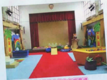
全港最大型感覺統合館命名揭幕禮